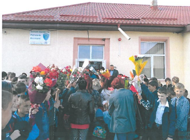
Deschiderea anului școlar 2018