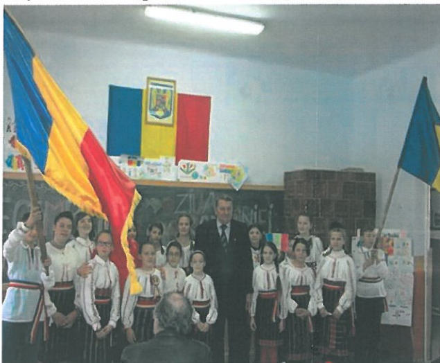
Sărbătorirea Centenarului Marii Uniri

Rezultatele investițiilor din învățământ se reflectă în performanțele dascălilor și copiilor noștri care ne reprezintă la olimpiade și concursuri sportive locale sau județene.