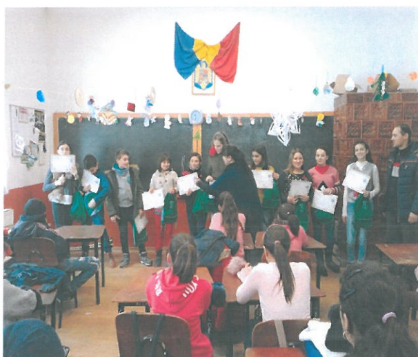
Premierea patrulei de reciclare